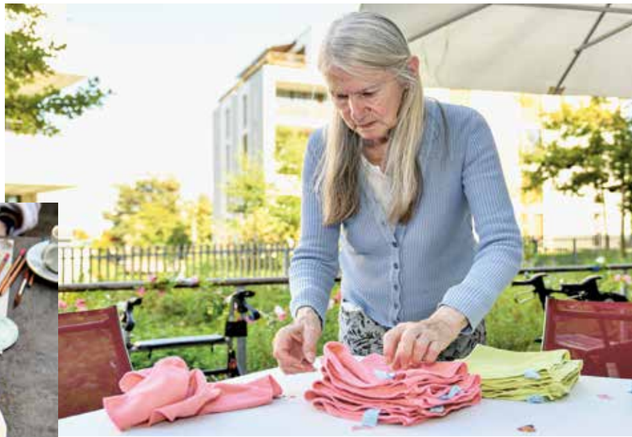
Farbigi Wöschbiegeli mache.