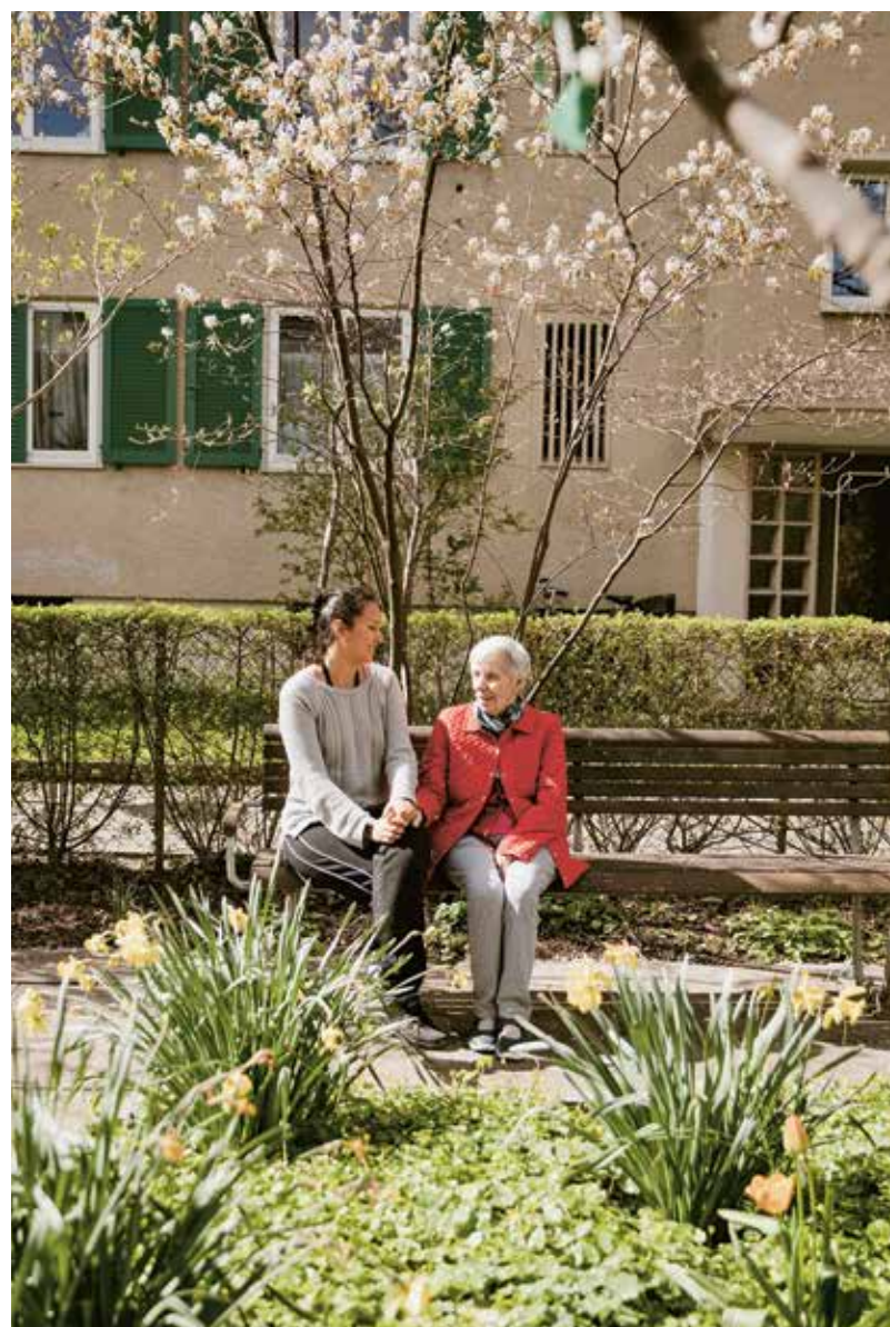
Un momento di riposo in cui lasciare spazio ai ricordi.