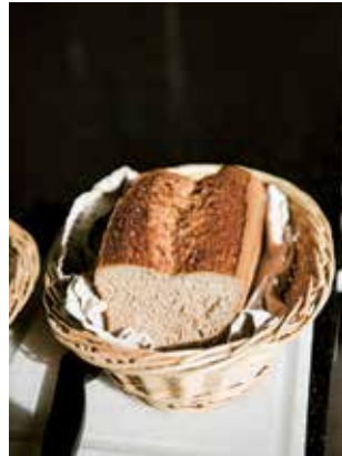
«Pane appena sfornato per colazione.»