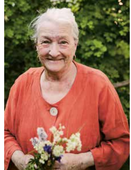
«Mier händs eifach schön.»