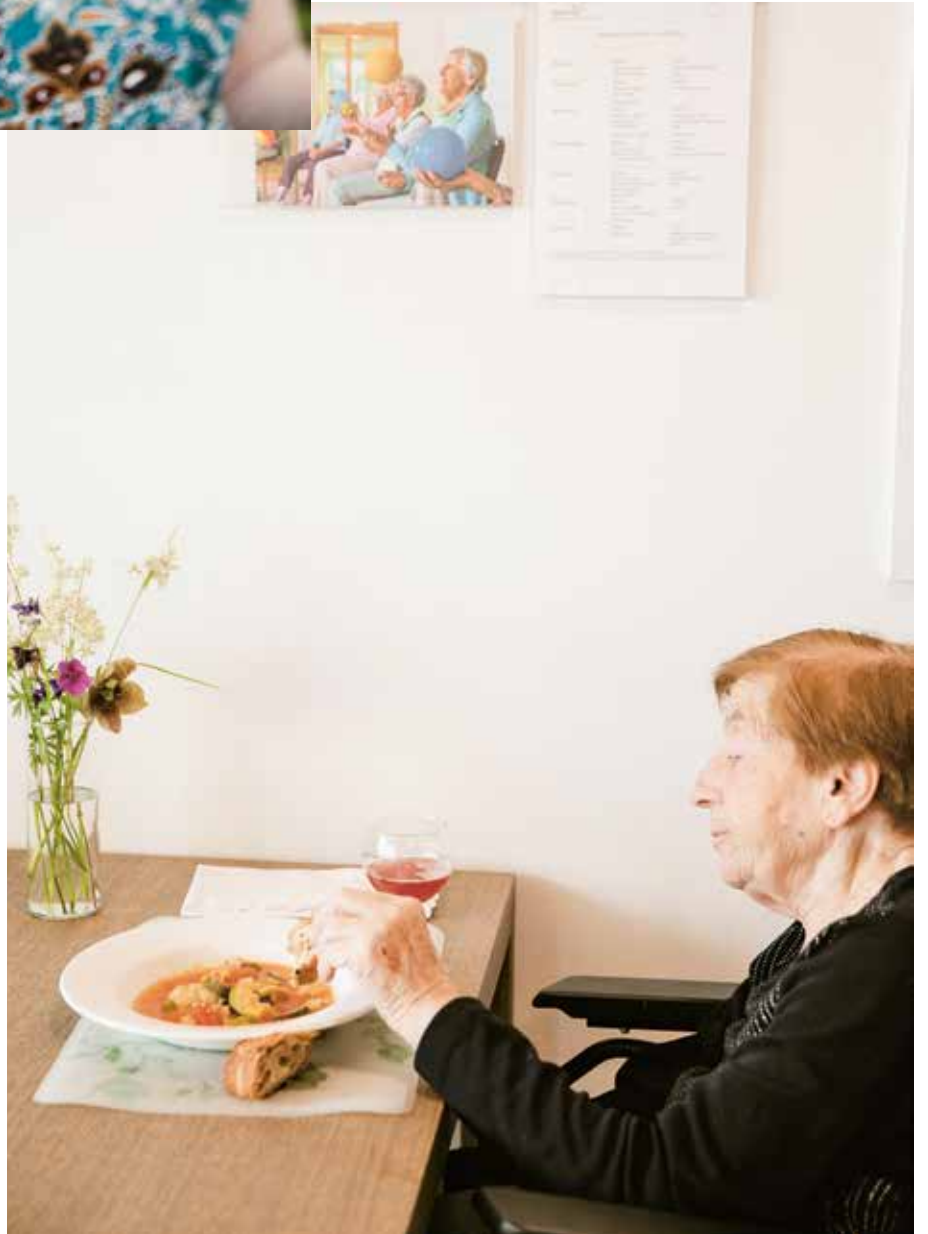
Ein bisschen wie im Hotel.