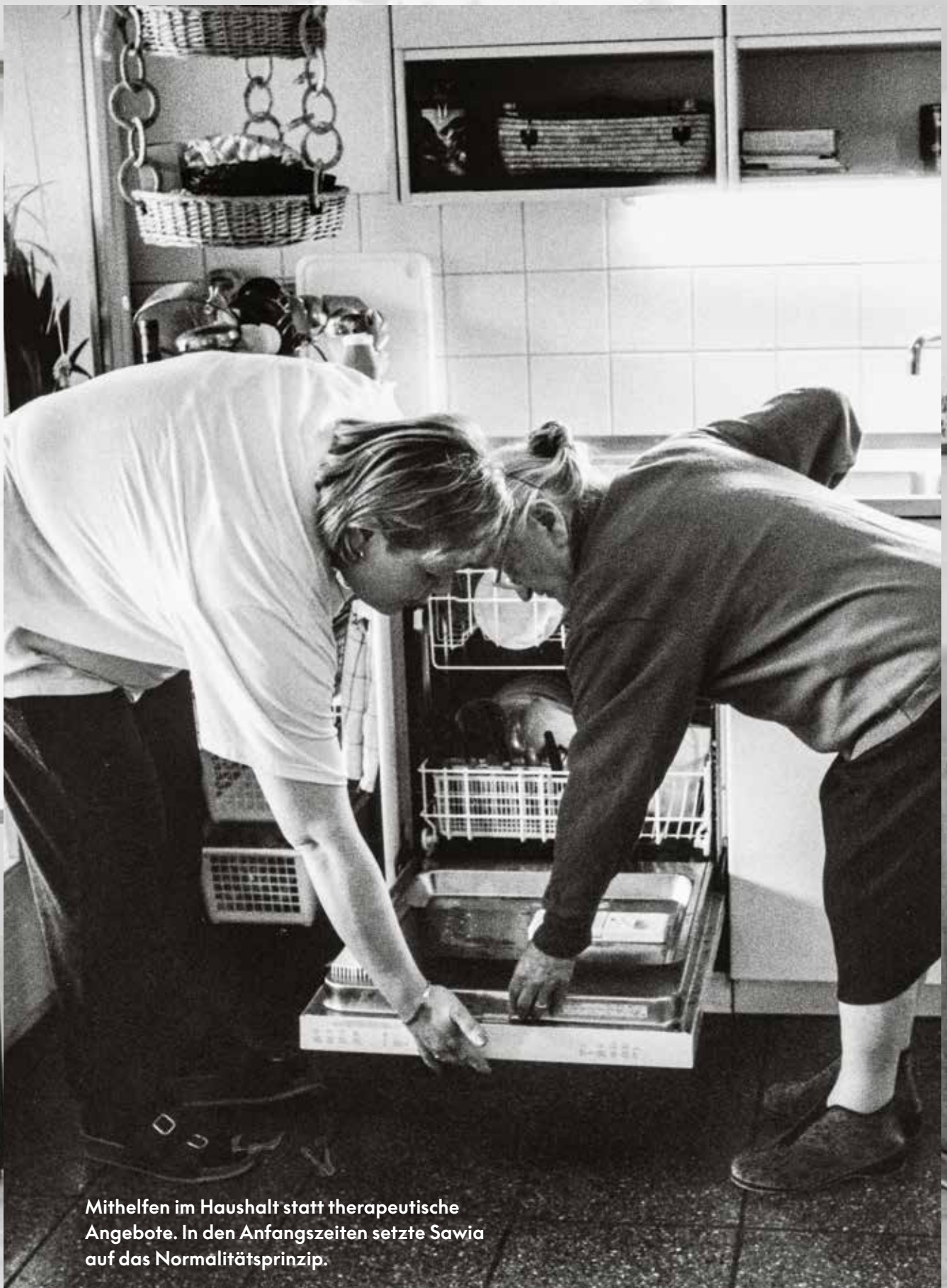
Mithelfen im Haushalt statt therapeutische Angebote. In den Anfangszeiten setzte Sawia auf das Normalitätsprinzip.